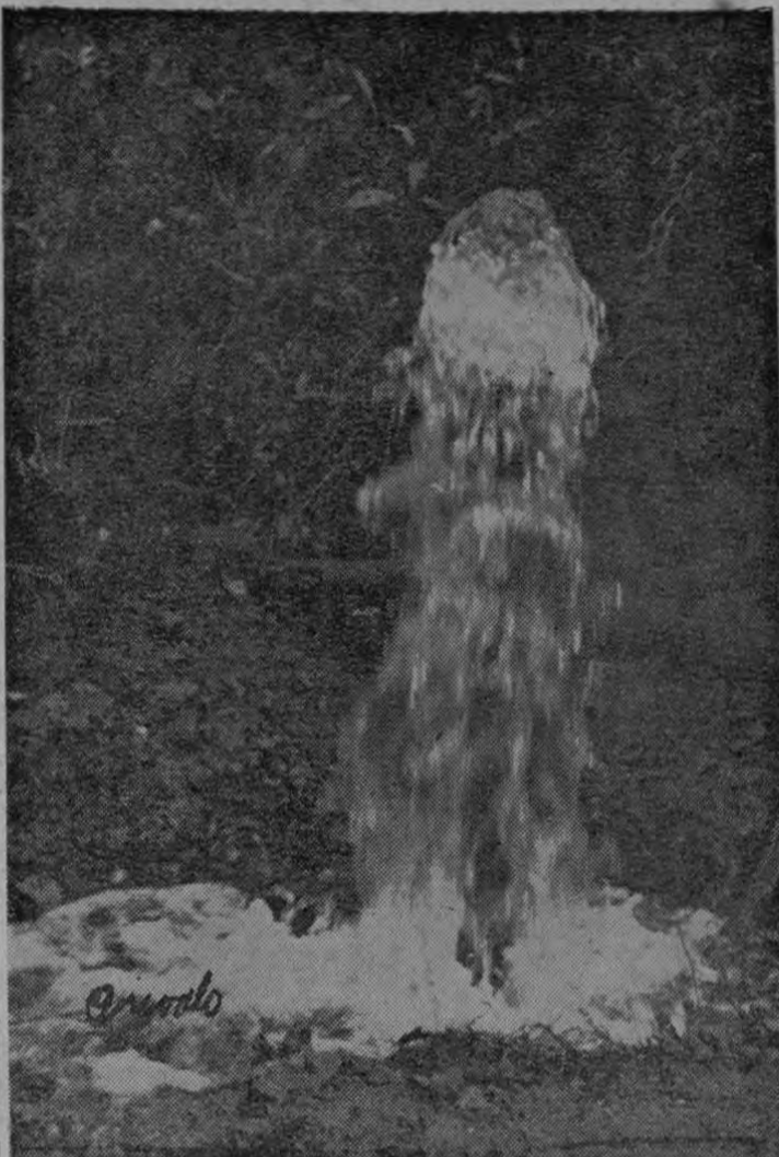
Así brota el agua en las perforaciones verticales que se han ordenado en la Fina La Laguna para aprovechar mantos acuíferos de mucha riqueza.

El Ministerio ordenó investigar la denuncia, por conducto de la Inspección General de Autoridades; se tomará declaración indagatoria de 15 vecinos, para determinar cual es la verdadera situación, antes de resolver la petición de los 95 vecinos, que demandan, en su memorial, la destitución del actual Jefe Político de Orotina.