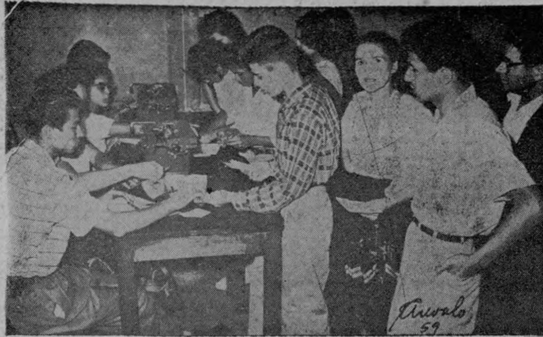
1.200 alumnos han sido matriculados por los propios alumnos en menos de dos días. Aquí estudiantes cumpliendo con la tarea de la matrícula según el nuevo experimento del Liceo Vargas Calvo en San Pedro — (Foto Arévalo)

Ellos matriculan en el Liceo Vargas Calvo.— 1.000 alumnos han pasado ya por este expediente.